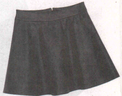
Evasê (R$ 79,90), da Riachuelo