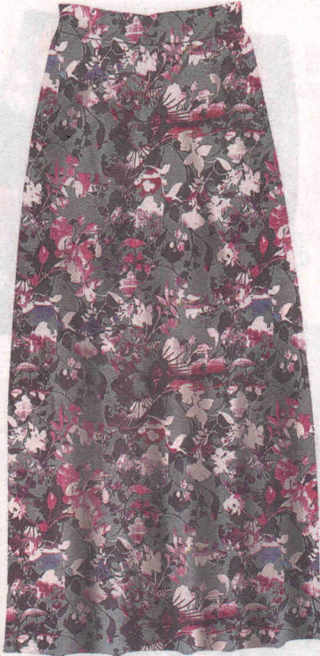
Longa (R$ 99,90), da Mineral