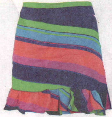
Envelope (R$ 109,90), da Lança Perfume para a Dafiti