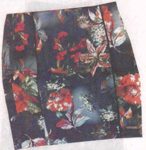
Tulipa (R$ 159,80), da Osmoze