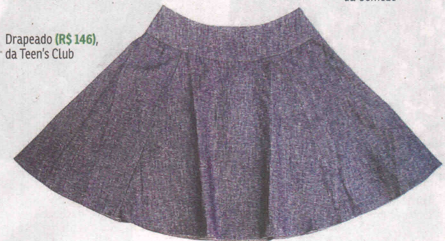
Drapeado (R$ 146), da Teen's Club