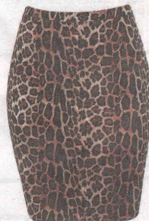
Cintura alta (R$ 79,90), das Lojas Renner