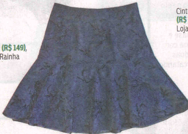
Trompete (R$ 149), da Santa Rainha