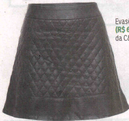
Evasê (R$ 69,90), da C&A