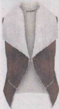
De pelos e couro sintéticos (R$ 139,99), na Passarela.com