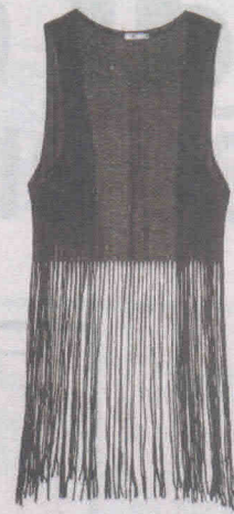
Com franjas (R$ 39,90), da Riachuelo