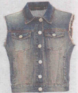
Jeans (R$ 129,90), da Memove