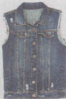
Com efeito detonado (R$ 139), da C&A