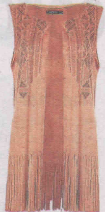
Estilo country (R$ 79,90), da Dafiti