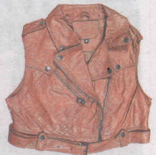
Imitação de couro (R$ 49,50), do Lojão do Brás