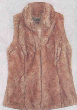
De pelo "fake" e gola alta (R$ 129,90), da Riachuelo