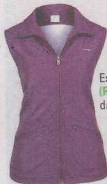
Esportivo (R$ 119,99), da Rainha