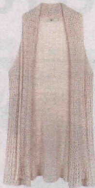
De linho bordado (R$ 89,90), da Riachuelo